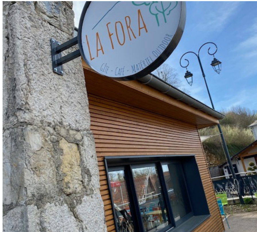
GÎTE-RESTAURANT LA FORA