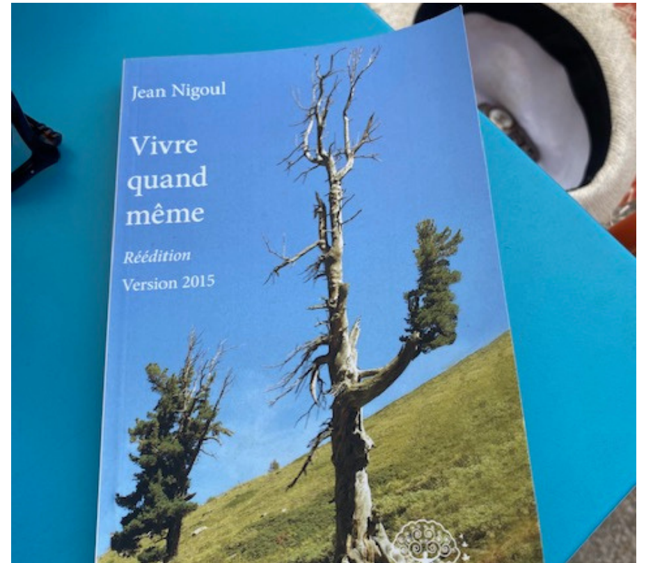
LIVRE "VIVRE QUAND MEME" (JEAN NIGOUL)