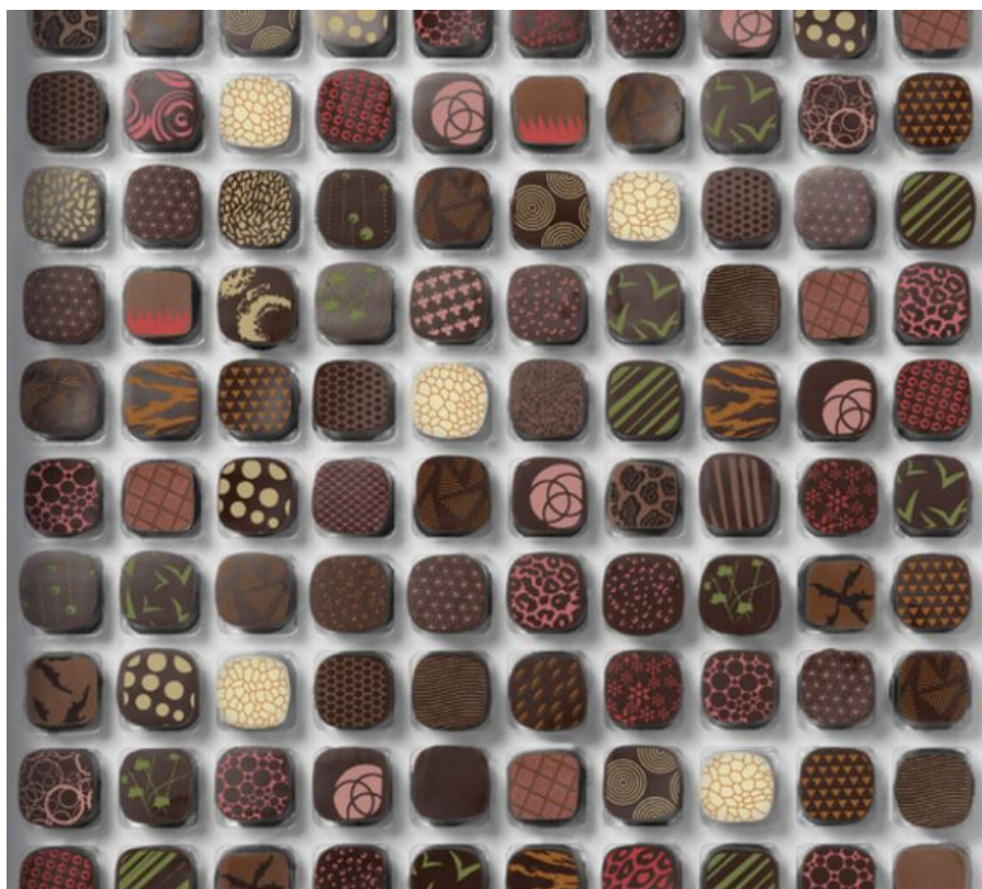
L'AROMERAIE DE LA MAISON RICHART