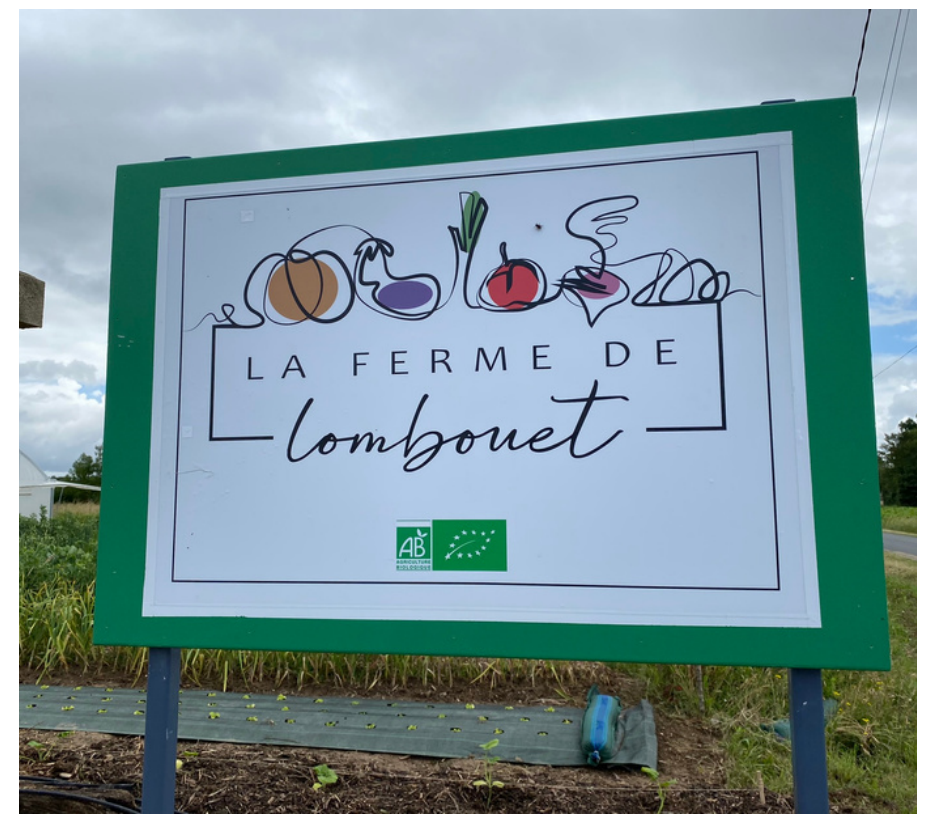
LA FERME DE LOMBOUET