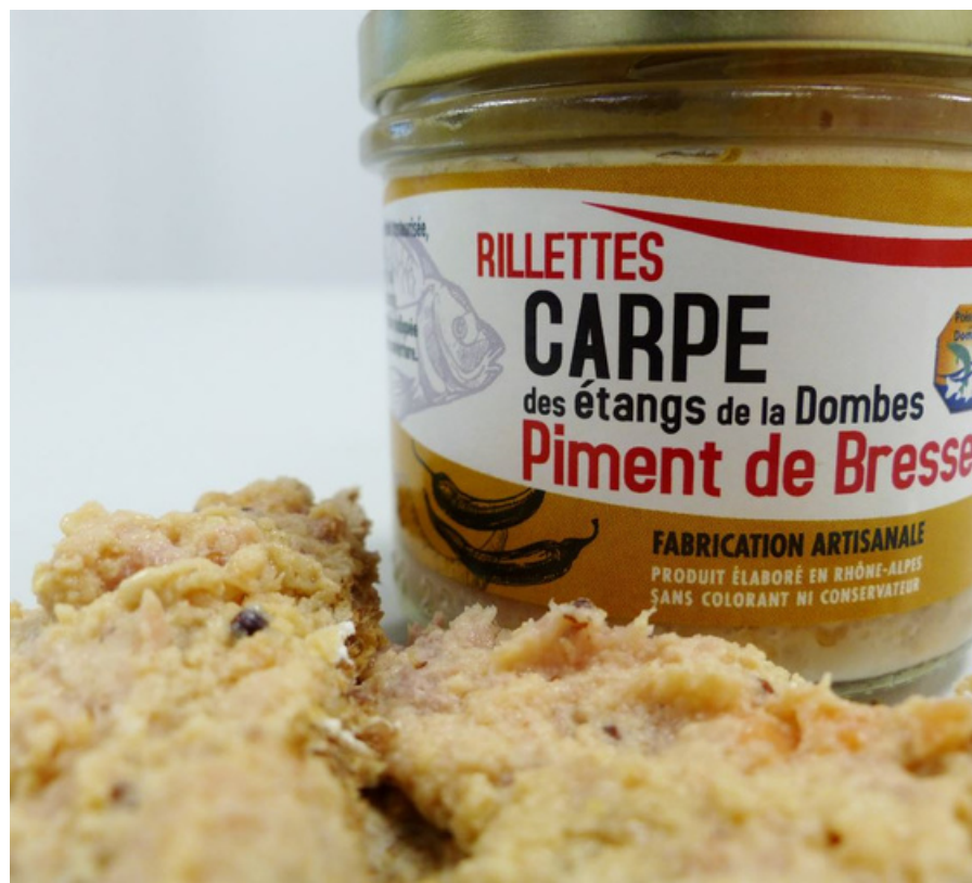
LE FUMET DES DOMBES